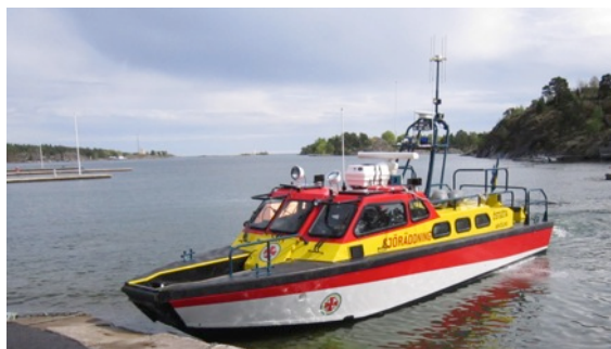
Sjöräddningssällskapet f.d. båt i Arkösund Rescue Östgöta. Bilden är inte kopplad till denna händelse.

Det blev stort pådrag på en gång. Bekräftad PIW tillhör det som resulterar i stort pådrag omedelbart.