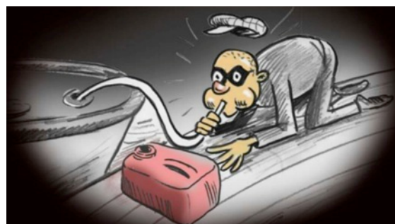
I Lysekil valde tjuven fel däckanslutning och " slangande" direkt ur septitanken i stället för bränsletanken. Kanske detta är en lösning med sugstationerna?

Jag tror inte någon av oss har lagt märke till någon anpassning eller förbättring med möjligheterna för fritidsbåtarna att lämna toalettavfallet i land inför den nya lagstiftningen som infördes den 1 april 2015.