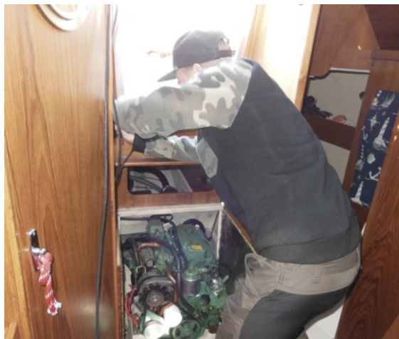
Här åker en trött Volvo Penta MD 2002 från -80 talet ut för att ersättas av en ny Volvo Penta D1-20.

Man kan kostatera att det finns många båtar som är byggda under -70, -80 och -90 talet om man tar en promenad längs våra bryggor i hamnen. I dessa båtar finns det motorer som kan vara över 30 år gamla, de flesta är nästan minst 20 år. I många segelbåtar är de flesta motorer en till tvåcylindriga dieselmotorer