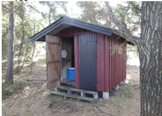
Miljöstationen, i form av toalett och sop-Maja på Risö.

För er som inte känner till det försågs många välbesökta öar med miljöstationer i form av torrdass och sop-Major. Detta skedde i slutet på 70-talet och i början på 80-talet. Fördelen med dessa stationer är att toalettavfallet komposteras. Sedan dess har ingen utbyggnad skett.