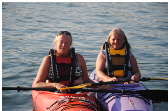
Damerna på bilden paddlar inte längre bort än att de kan skrika efter hjälp.

I vissa fall är det lätt att förstå att man missförstår vädret. När SMHI varnar för hårda vindar är det vindstyrkor över 14 m/s. Vi med fritidsbåtar tycker väl att den gränsen går vid 7-8 m/s. För en kanotist som paddlar utmed en kust som saknar skydd av öar och skär går kanske gränsen redan vid 3-4 m/s. Då är det inte konstigt att den som är ovan kan råka illa ut. Men de flesta som omkommit i kanotolyckor gör det inte på grund av hårt väder. Det är snarare kallt vatten och i ett par fall strömmande vatten som har varit problemet. Nästan alla dödliga kanotolyckor inträffar i sötvatten. De som paddlar havskajaker i ytterskärgårdarna har hittills klarat sig bra även om några blivit sjöräddningsfall.