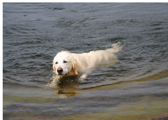
Hunden Gordon gillar att bada. Dock är det bevisat att hundar använder flytvästar bättre än gamla gubbar.

Visste ni att hundar är bättre än män när det gäller att använda flytväst. Varje år gör Transportstyrelsen en observationsstudie där vi fotograferar båtar. Hjälper till gör SXX, SSRS, Livräddningssällskapet, Svenska Båtunionen och en del privatpersoner. Vi gör det på 7 olika platser runt kusten. Resultatet är att vi får in flera tusen bilder. Varför gör vi detta? Jo, bilderna analyseras för vi vill se vilka slags båtar som förekommer, hur många som använder flytväst, om båtarna har räddningsstegar, hur många som har jolle osv. Spin-off-effekter är till exempel att vi kan räkna hur många båtar som styrs av en kvinna. Ska bli spännande att se om det ändrar sig under ett decennium.